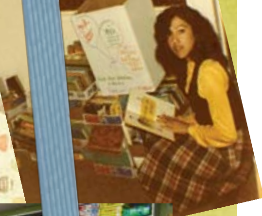
La Biblioteca de Recursos de CRS Los primeros años...