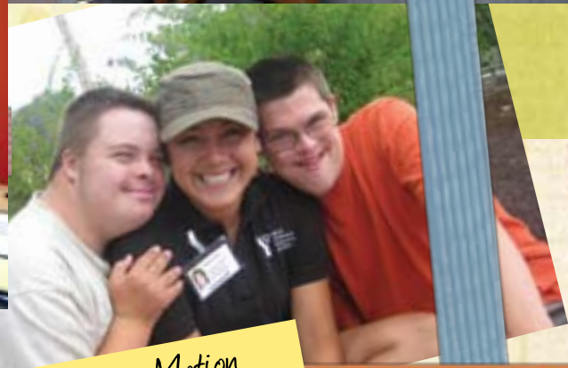
Teens in Motion