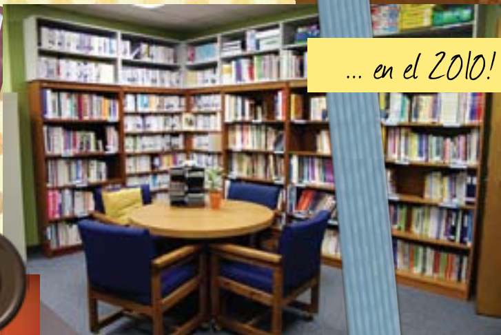
... en el 2010!