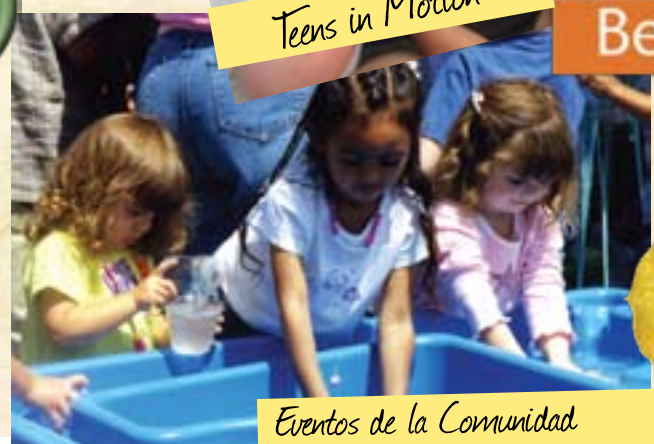
Eventos de la Comunidad