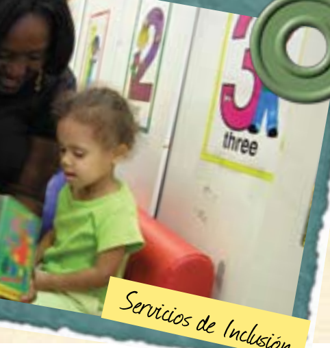
Servicios de Inclusión