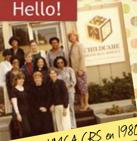
Personal de YMCA CRS en 1980